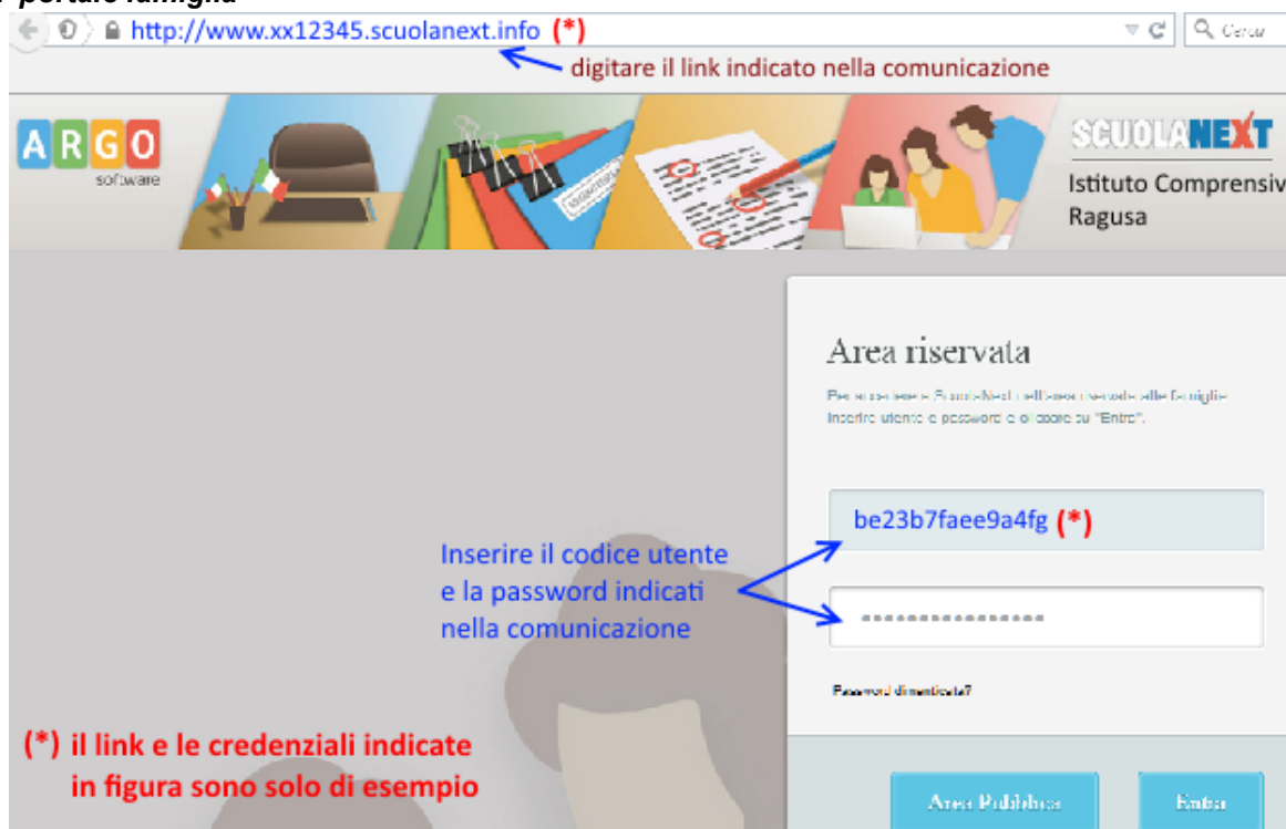
Fig. 2 portale famiglia

Basta avere un pc collegato ad internet, aprire il browser di navigazione ( consigliati mozilla firefox e google chrome ) e digitare o incollare il link indicato nella comunicazione.